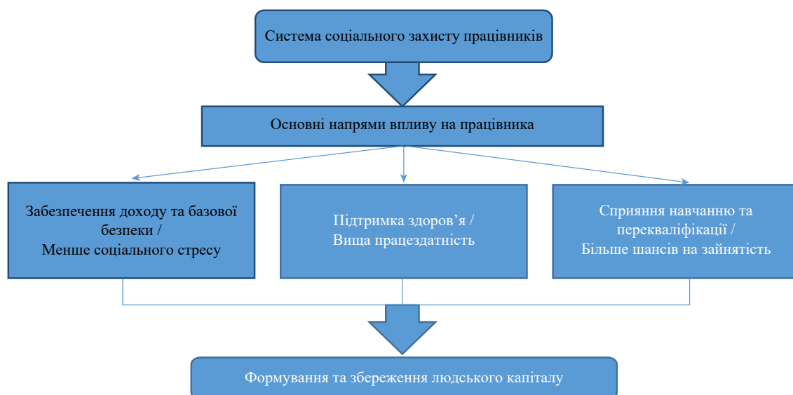
Рис. 2. Механізм впливу соціального захисту на розвиток людського капіталу

Отже, на сучасному етапі соціальний захист працівників в Україні не виконує повною мірою свою ключову функцію – зменшення соціальних ризиків і підтримку розвитку людського капіталу. Його потенціал стримують фінансові, інституційні й структурні бар'єри. Водночас слід підкреслити: соціальний захист – це не лише елементом соціальної справедливості, а й стратегічний ресурс держави (рис. 2).