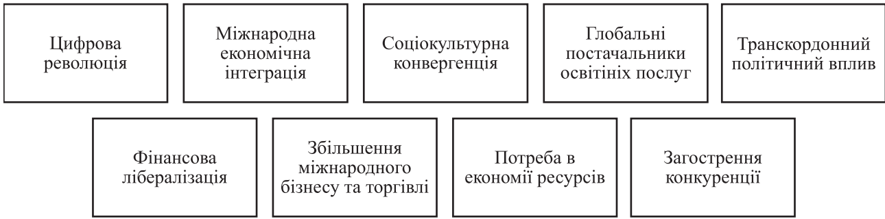
Рис. 1. Основні рушійні сили процесу глобалізації