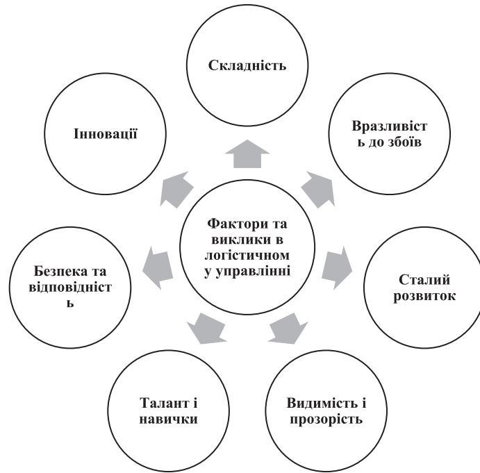
Рис. 4. Фактори та виклики в логістиці та управлінні ланцюгами поставок