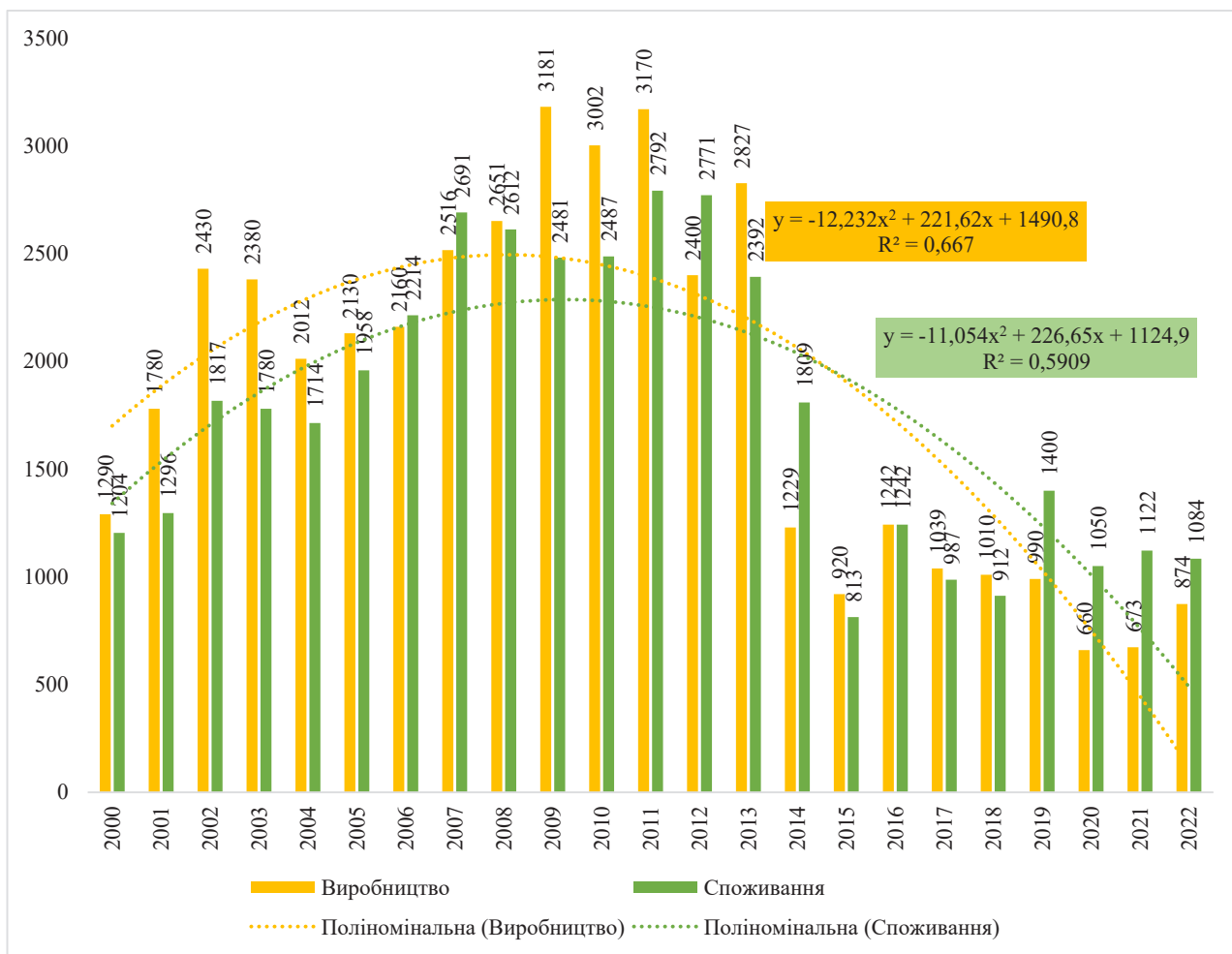
Рис. 1. Динаміка обсягів виробництва та споживання вина в Україні, 2000-2022 рр.