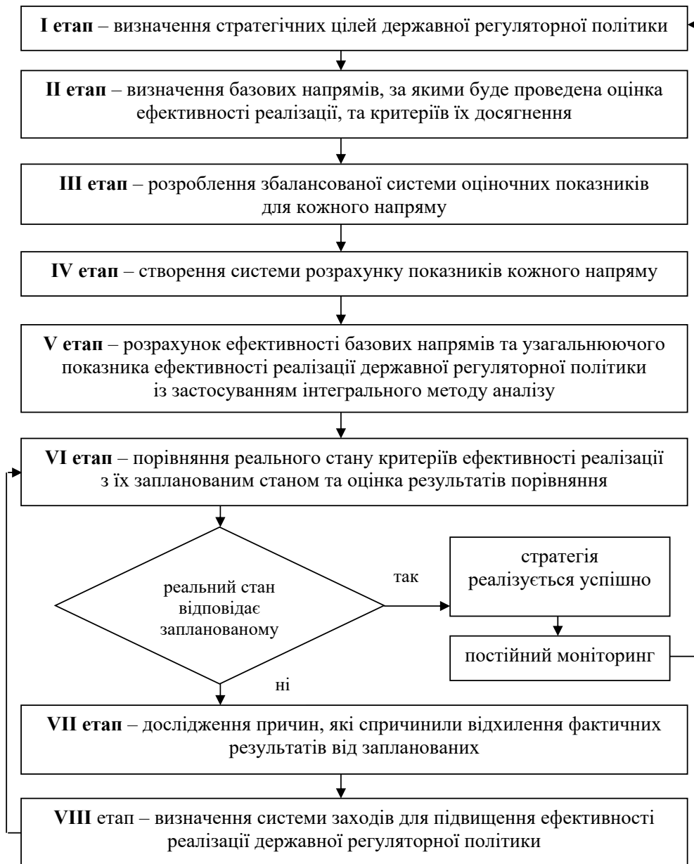
Рис. 1. Схема оцінювання ефективності реалізації державної регуляторної політики

На першому етапі відбувається визначення стратегічних цілей державної регуляторної політики з урахуванням інтересів дер-