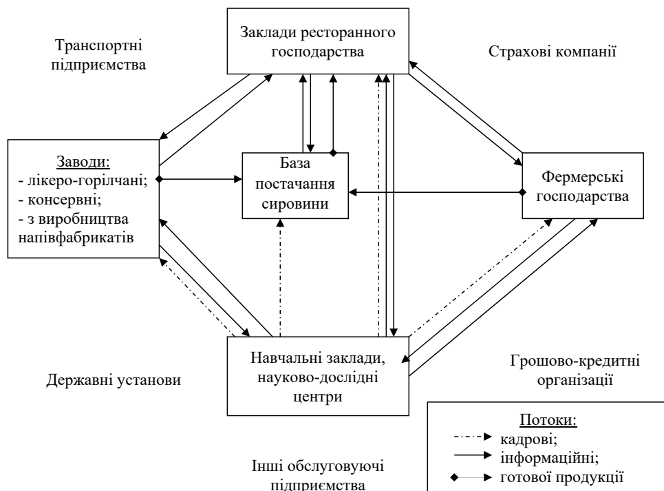
Рис. 2. Механізм взаємодії кластера ресторанного господарства