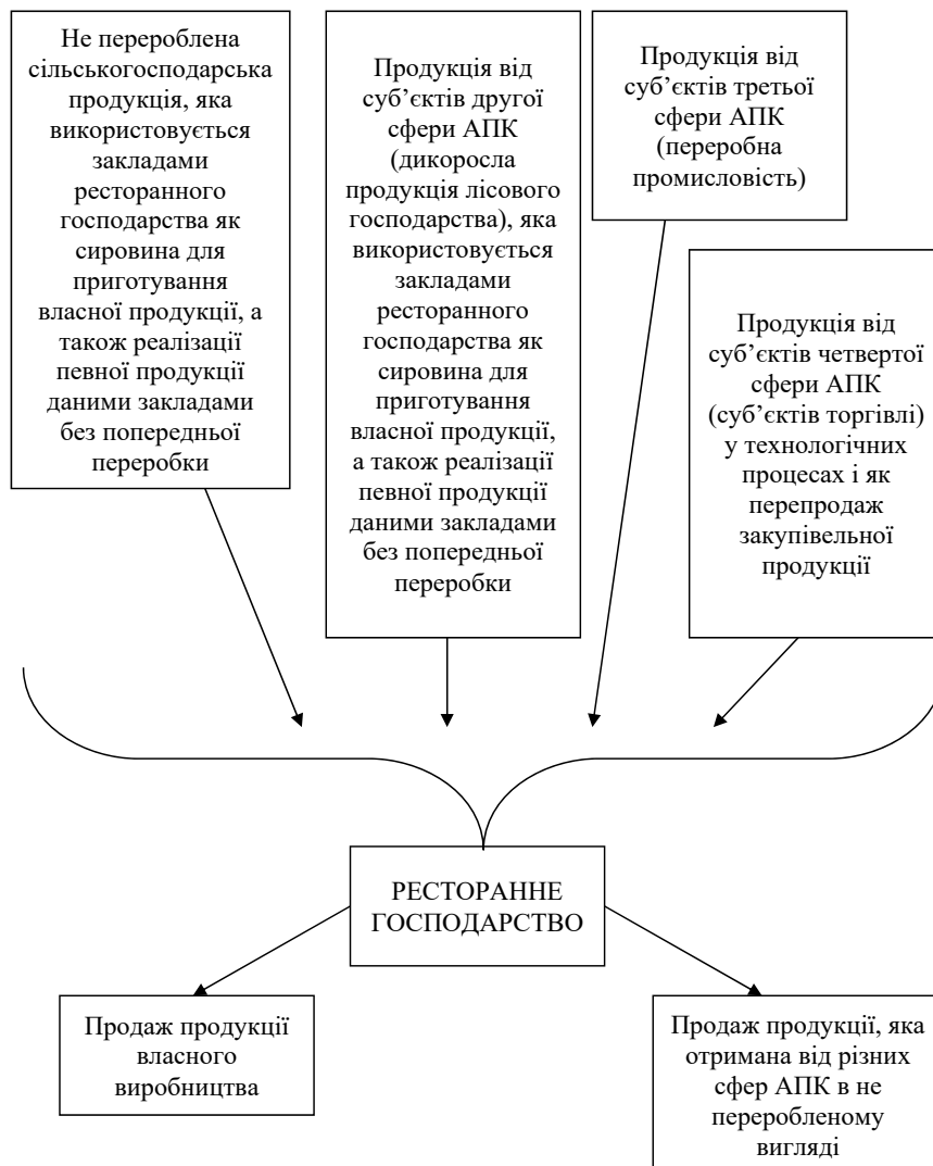
Рис. 1. Класифікація продовольчих продуктів АПК, які реалізуються закладами ресторанного господарства

Для використання переважно вітчизняної продукції для приготування страв у закладах ресторанного господарства варто використовувати замкнутий цикл виробництва, який відбуватиметься під замовлення підприємств ресторанного господарства (рис. 1).