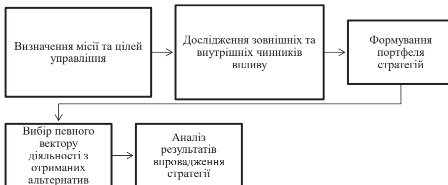
Рис. 2. Послідовність розроблення стратегії забезпечення фінансової безпеки підприємства