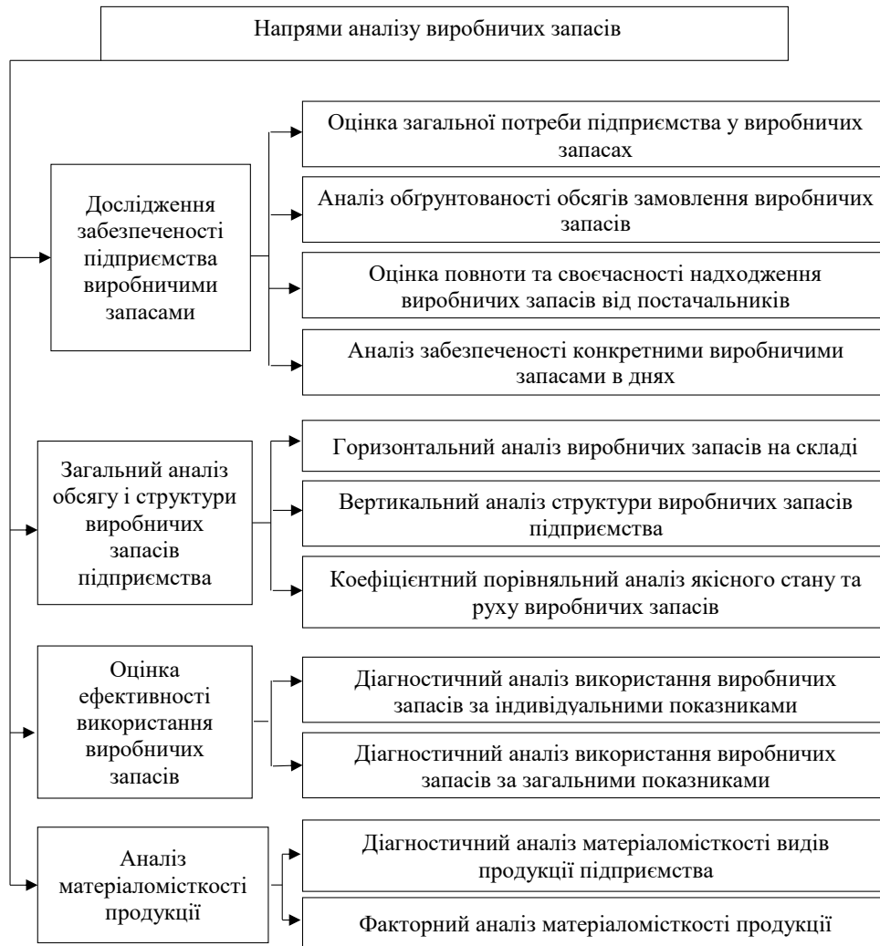
Рис. 2. Напрями аналізу виробничих запасів підприємств