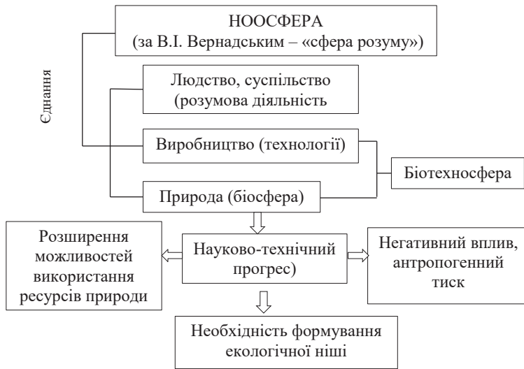
Рис. 1. Схематичне зображення вчення В.І. Вернадського про ноосферу