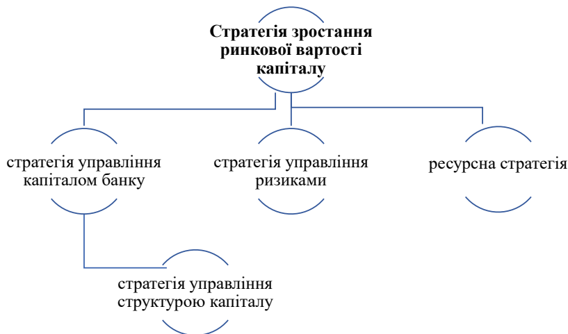
Рис. 1. Ієрархія підстратегій в системі корпоративної стратегії банку

За період з початку 2017 року до серпня 2019 року банківська система України збільшила свою капіталізацію шляхом поповнення статутного капіталу в 55 банках на 35,3 млрд грн [20, с. 2]. За рахунок власних коштів акціонерів банків зростання відбулось на 55% загальної суми. На другому місці знаходиться субординований борг, у розмірі 34%. Наповнення за рахунок прибутку відбулось у розмірі 9%, і усього 2% приходиться на процеси приєднання банків один до іншого.