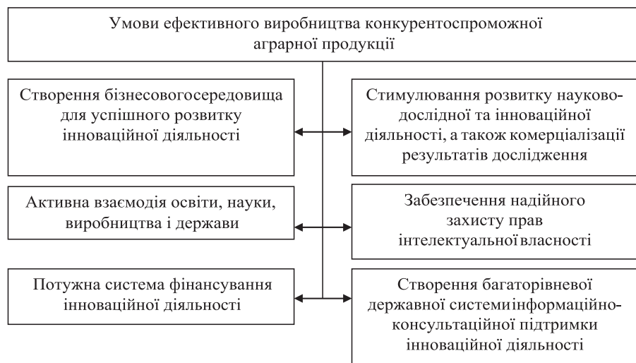
Рис. 3. Умови для забезпечення ефективного виробництва конкурентоспроможної аграрної продукції

Підкреслено, що в аграрній сфері України, як і у переважній більшості країн світу, активно роз-