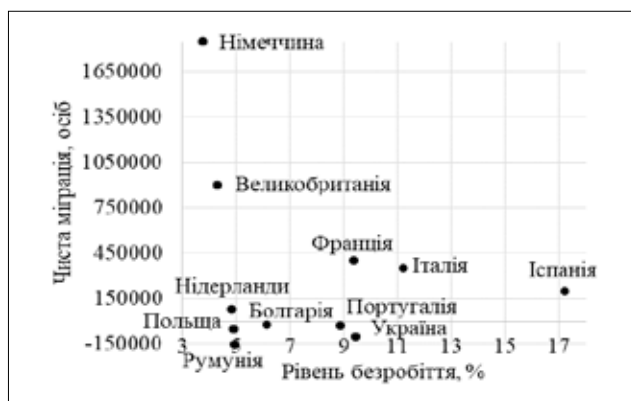
Рис. 1. Розміщення країн у координатах обсягів чистої міграції в розрізі індексу безробіття за 2017 р. Джерело: побудовано на основі даних [16]

Графічна інтерпретація залежності індексу безробіття від обсягів чистої міграції, свідчить, що показник рівня безробіття в Україні становить 9,45%, це на 1,72% більше від середнього значення даного показника країн (7,73%) [16]. Рівень безробіття в Іспанії сягнув 17,22% та є найбільшим порівняно з іншими досліджуваними країнами ТОП-10 та України, тобто на 9,49% більше від середнього значення показника по країнам [16]. Із досліджуваних країн найменший індекс безробіття (залежно від обсягів чистої міграції) у Німеччині – 3,75% (це на 5,7% нижче, ніж в Україні та на 13,47%, ніж в Іспанії), Великобританії – 4,33%, Нідерландах – 4,84%, Польщі – 4,89%, Румунії – 4,93%, Болгарії – 6,16%, Португалії – 8,87%, Франції – 9,4%, Італії – 11,21% [16]. Тоді як норма рівня безробіття становить до 5%, критичний рівень – 15%.