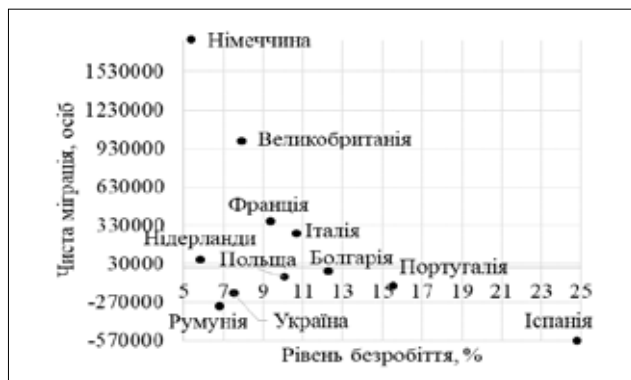
Рис. 2. Розміщення країн у координатах обсягів чистої міграції в розрізі індексу безробіття за 2012 р. Джерело: побудовано на основі даних [16]

Для порівняння проведемо аналіз залежності індексу безробіття від обсягу чистої міграції у 2012 р. (рис. 2). Зокрема, у Німеччині міграція становить 1 777 126 осіб у 2012 р., це найбільше значення по відношенню до інших країн ТОП-10 й України. Наступними країнами після Німеччини, у яких значний обсяг чистої міграції, є: Великобританія (990 000 осіб), Франція (361 722 особи), Італія (264 145 осіб), Нідерланди (62 687 осіб). Показник чистої міграції у 2012 р. досягає від'ємних значень в інших досліджуваних країнах: Іспанії (-570 000 осіб), Румунії (-299 997 осіб), Україні (-200 000 осіб), Португалії (-140 000 осіб), Польщі (-73 997 осіб) та Болгарії (-24 472 особи) [16].