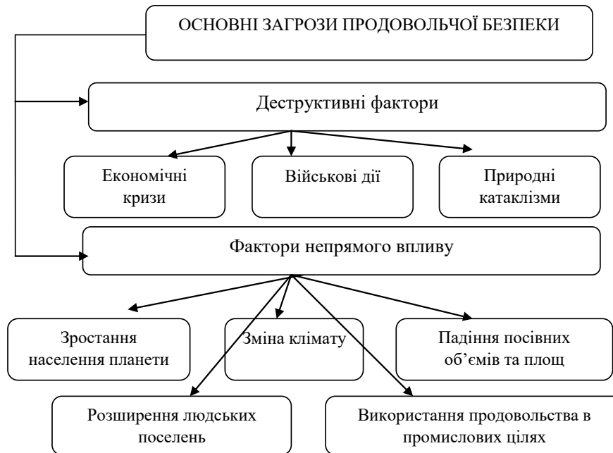
Рис. 1. Загрози продовольчої безпеки