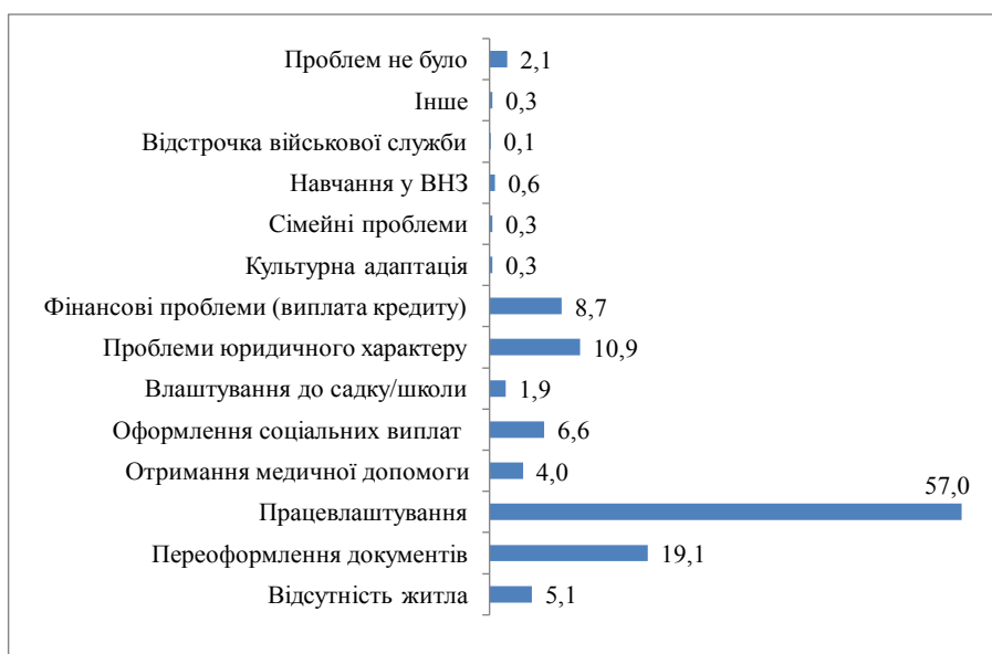
Рис. 1. Розподіл відповідей респондентів на питання «3 якими проблемами Ви зіткнулися після повернення?», %