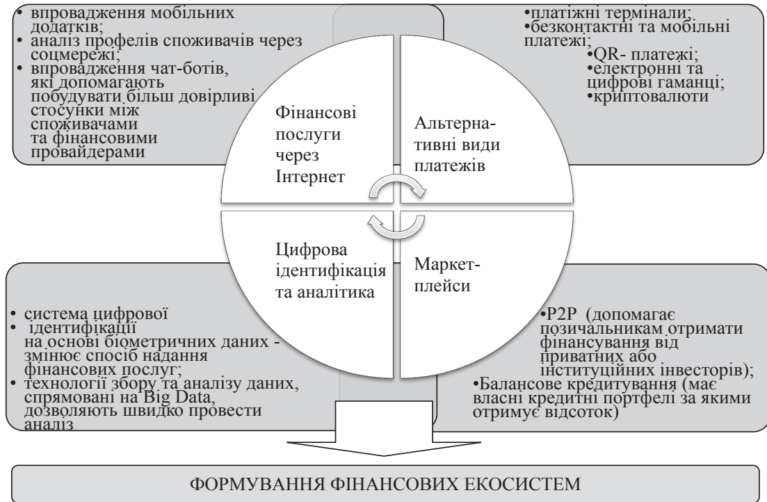
Рис. 1. Напрями розвитку фінансових технологій