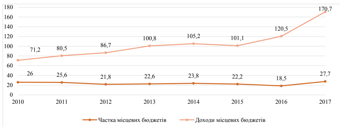
Рис. 2. Зміна доходів місцевих бюджетів та їхні частки у Зведеному бюджеті України за 2010–2017 рр.