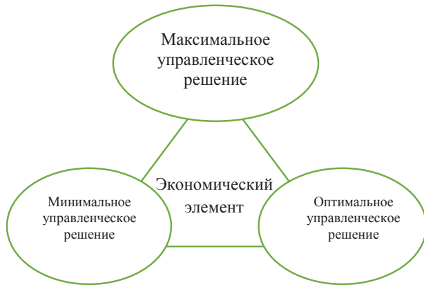
Рис. 3. Элементы экономической системы