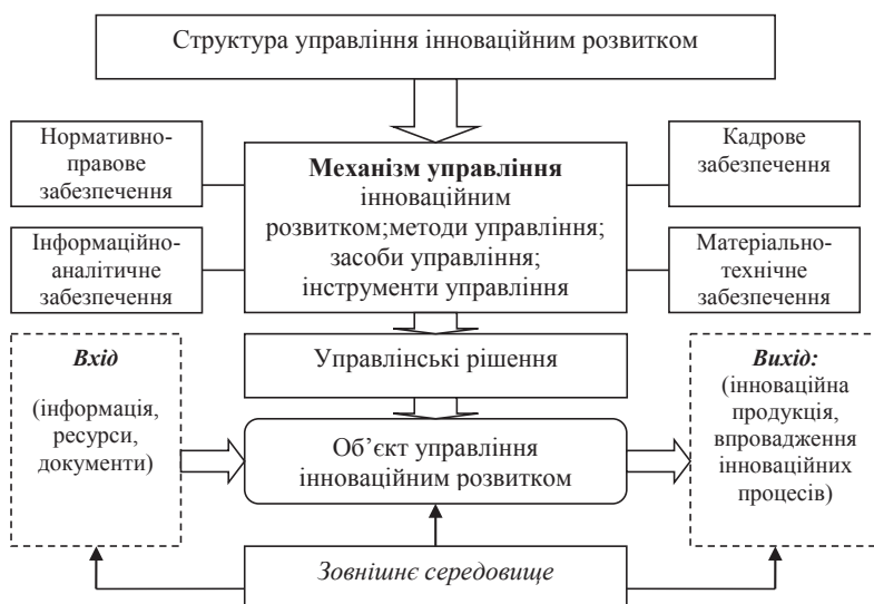
Рис. 2. Механізм управління інноваційним розвитком

Вхідним потоком для здійснення інноваційного розвитку туристичного підприємства є інформація, матеріали, ресурси та запити, а вихідним – результат дії механізму (впроваджена інноваційна продукція та інноваційні проекти її виробництва, процесні інновації у сфері управління, маркетингу, техніко-технологічного, інформаційного забезпечення тощо). Значний вплив на механізм управління інноваційним розвитком здійснюють фактори впливу зовнішнього середовища, зміни