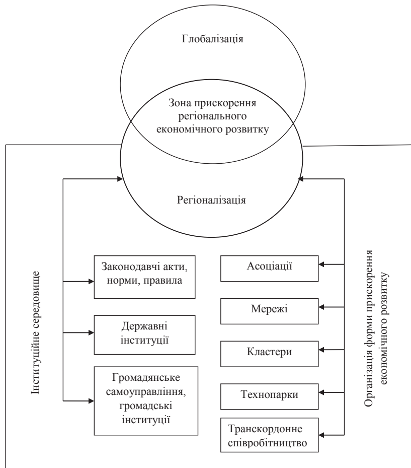
Рис. 1. Умови, інституційне середовище та організаційні форми прискорення економічного розвитку

Соціальна спрямованість економічного розвитку передбачає таке розміщення виробництва, яке б забезпечило повну зайнятість працездатного населення і встановлення рівня безробіття на рівні природної норми. Для цього необхідно розвивати ринок праці, створювати нові робочі місця. Соціальна спрямованість проявляється також в інтенсивному розвитку соціальної інфраструктури, у збереженні здоров'я людей, у зниженні екологічного навантаження, у формуванні оптимальної системи розселення в країнах регіонах.