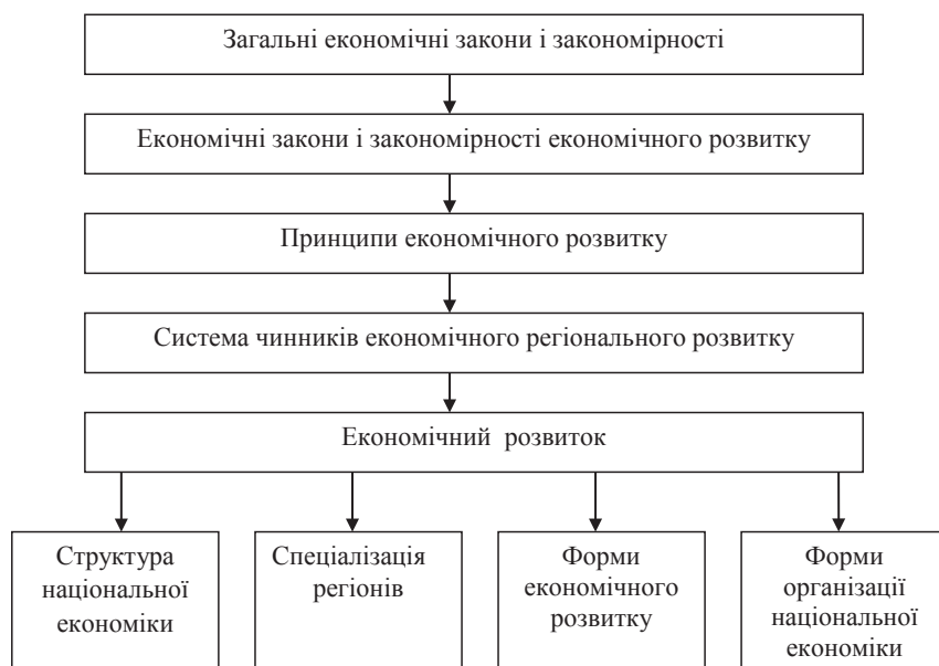
Рис. 2. Взаємозв'язок економічних законів, закономірностей принципів та чинників економічного розвитку

Соціальний складник механізму стійкого розвитку передбачає запровадження соціальних стандартів, побудову оптимальної мережі соціальної інфраструктури, реалізацію програм зайнятості населення, зростання рівня і якості життя, забезпечення рівного доступу до соціальних благ. При цьому важливу роль відіграє державно-приватне партнерство [1]. У різних формах воно сприяє вирішенню соціальних проблем, накопичених в тих чи інших регіо-