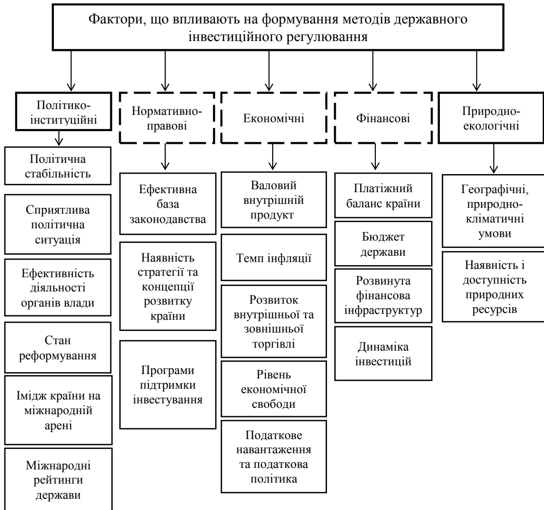
Рис. 3. Фактори, що впливають на формування методів державного інвестиційного регулювання