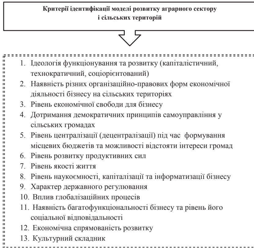
Рис. 1. Характеристика критеріїв для визначення взаємоузгоджених моделей розвитку аграрного сектору і сільських територій

Під час визначення типів сільського господарства використано загальновідомі підходи і критерії. Натомість визначення місця і ролі сільських територій у кожному із зазначених типів аграрного сектору, а також «вмонтування» фактору територій до моделей розвитку галузі потребують чіткої інтерпретації критеріїв для ідентифікації таких моделей. В авторській інтерпретації визначено такі критерії: ідеологія функціонування та розвитку; багатокладність економіки; рівень економічної свободи; дотримання демократичних принципів самоуправління у місцевих громадах; рівень централізації/децентралізації; рівень розвитку продуктивних сил; рівень якості життя; рівень наукоємності, капіталізації та інформатизації; характер державного регулювання; вплив глобалізаційних процесів; наявність багатфункціональності бізнесу та його соціальної відповідальності; екологічна домінанта функціонування і розвитку; роль культурного фактору (рис. 1).