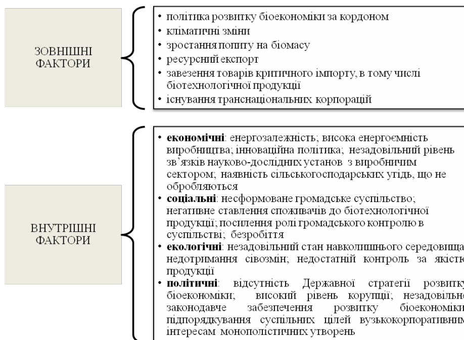
Рис. 1. Фактори впливу на розвиток біоекономіки в Україні