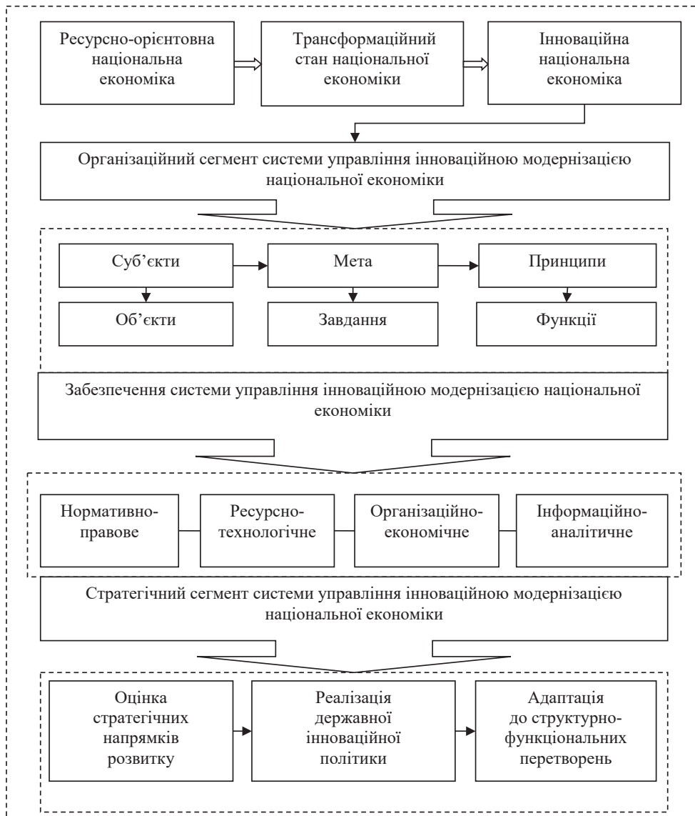
Рис. 3. Модель системи управління інноваційною модернізацією національної економіки

Модель системи управління інноваційною модернізацією національної економіки, яка відповідає базовим принципам формування та функціонування, представлена на рис. 3. До складу представленої системи управління входять сегментні