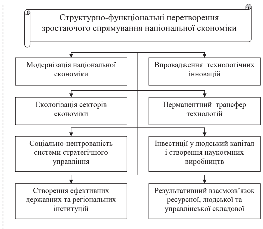
Рис. 1. Варіативність структурно-функціональних перетворень у національній економіці

тивну та «потрійну спіраль», кожна з яких характеризується певними ознаками життєвого циклу створення інновацій, напрямками генерації знань, а також принципами фінансування інноваційних розробок [3]. Але при цьому слід зауважити, що визначені моделі не враховують національних особливостей, що знижує ефективність впровадження та використання конкретної формації інноваційної системи, що підтверджується результатами досліджень міжнародних наукових організацій та співтовариств (CORDIS).