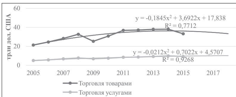
Рис. 1. Мировая торговля товарами и услугами в 2005–2017 гг. Источник: [9]

По оценкам Института экономических исследований и политических консультаций (Украина), Копенгагенского экономического института (Нидерланды), Института восточноевропейских исследований (Германия), интеграция в систему