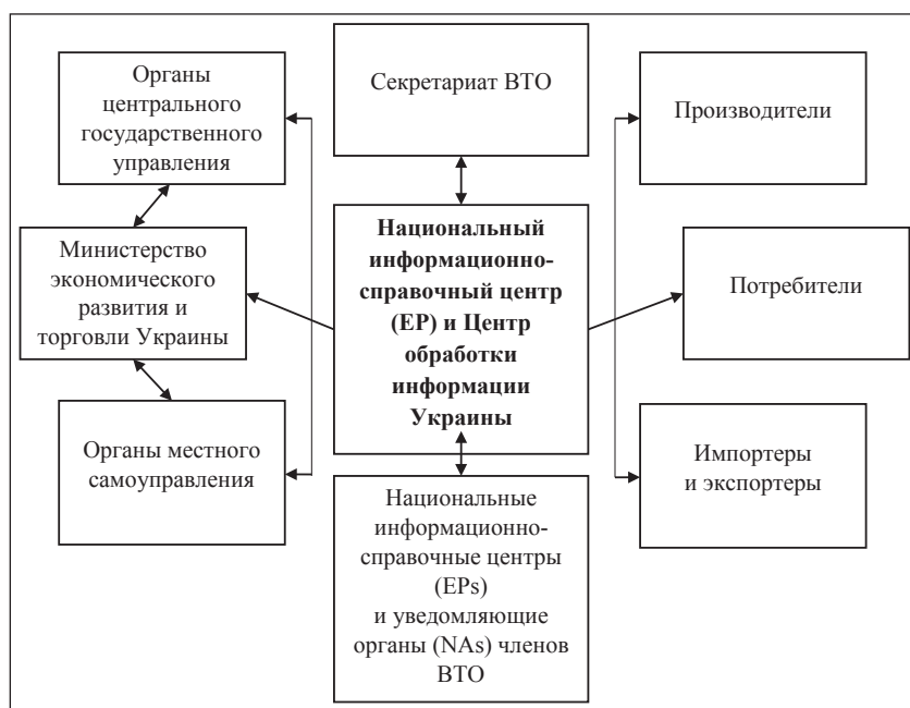
Рис. 4. Импортные тарифы Украины