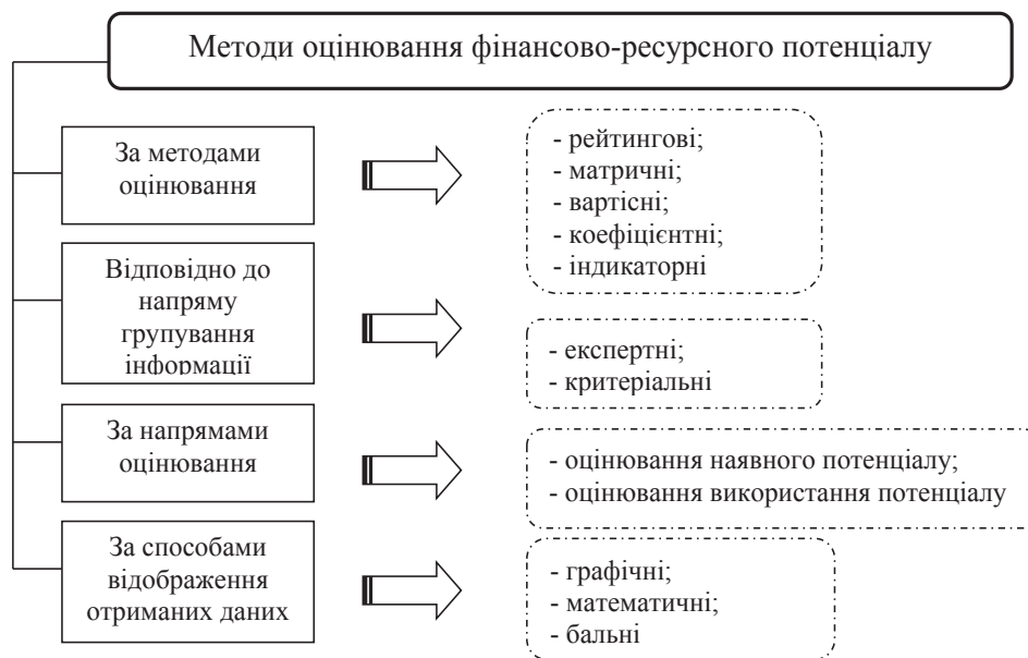
Рис. 1. Диференціація методів оцінювання фінансово-ресурсного потенціалу підприємства

Під час використання ресурсно-регресійного методу оцінювання потенціалу застосовують кореляційно-регресійні моделі, що відтворюють вплив певних чинників на результати фінансово-господарської діяльності. Менеджер має змогу визначити вплив зміни складників потенціалу підприємства. Відмінність методу від розглянутих вище полягає у можливості за допомогою його застосування оцінювати вплив змін структурних складників на економічний потенціал підприємства.