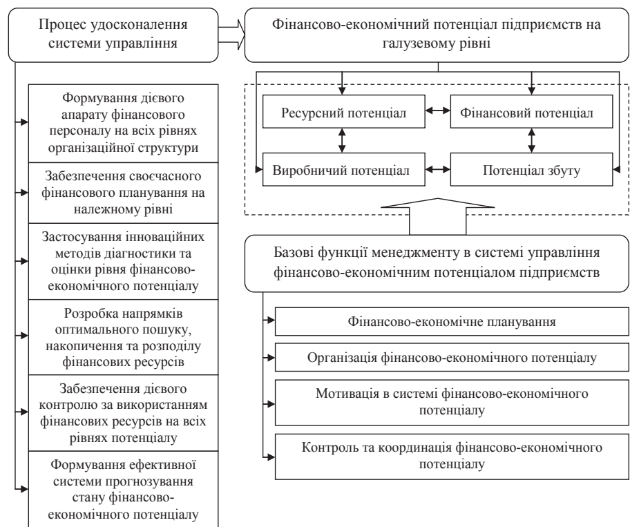
Рис. 2. Базовий механізм удосконалення системи управління фінансово-економічним потенціалом підприємств на галузевому рівні

Ураховуючи ключові елементи вищеведеного механізму, сформуємо основні напрями вдосконалення системи управління фінансово-економічним потенціалом підприємств саме досліджуваної залізорудної галузі. Першочерговим завданням є формування ефективного і реально дієвого кадрового апарату з вирішення фінансових питань, причому на всіх рівнях організаційної структури залізорудних підприємств та на всіх етапах їх виробничо-збутового процесу. Слід сказати, що будь-