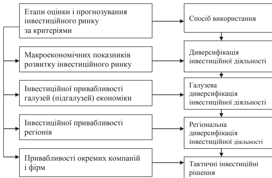
Рис. 1. Етапи дослідження інвестиційного ринку

На рис. 1 представлена послідовність етапів оцінки і прогнозування інвестиційного ринку. Ринкові взаємовідносини у вітчизняній економіці України продовжують ускладнюватись, що пояснюється