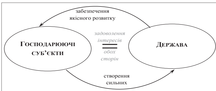
Рис. 2. Схема взаємодії економічних агентів у процесі інституціонального перетворення