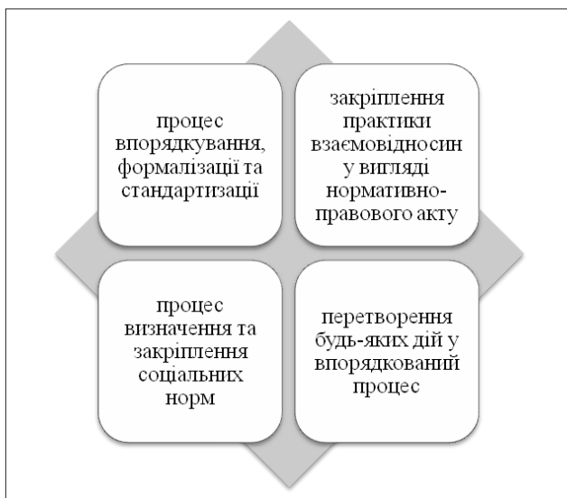
Рис. 3. Складники поняття інституційного забезпечення