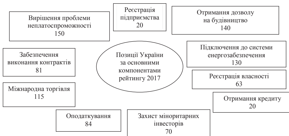
Рис. 2. Позиції України за основними компонентами рейтингу Doing Business 2017 року