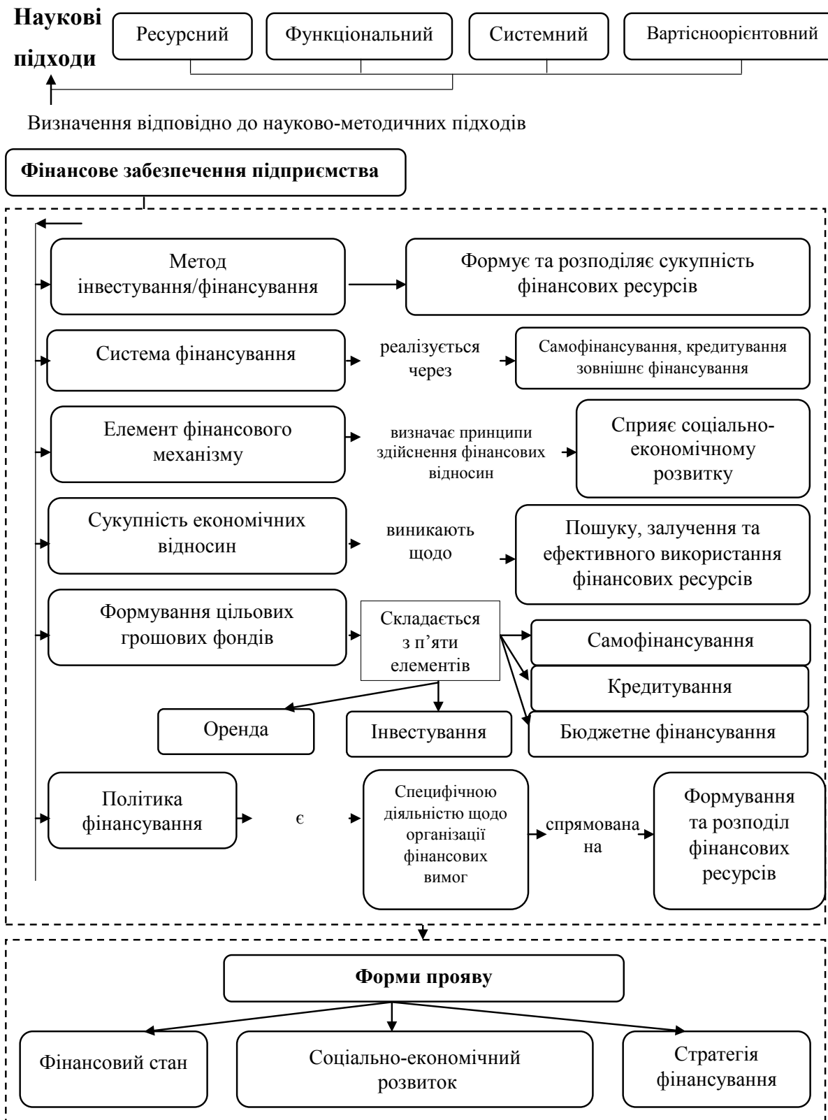
Рис. 1. Узагальнення характерних ознак фінансового забезпечення підприємств