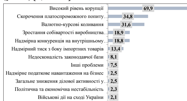
Рис. 2. Розподіл відповідей респондентів щодо основних проблем на ринках збуту основної продукції їхніх підприємств у 2017 р., %

(69,9% – полягає у наданні дозволів, пільг та привілеїв певним суб'єктам господарювання) (рис. 2) [2, с. 204].