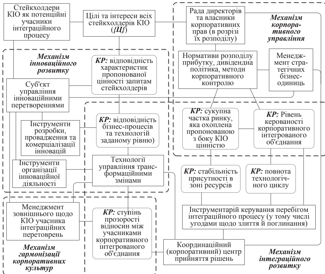
Рис. 5. Статичне представлення механізму інноваційно-інтеграційного розвитку корпоративного об'єднання підприємств