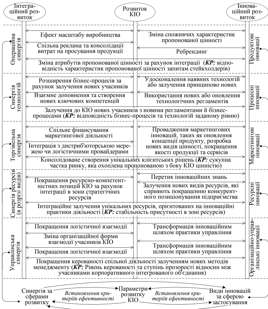
Рис. 2. Логіка одночасного розкриття інноваційних та інтеграційних властивостей категорії розвитку в рамках КІО

Загалом означена на рис. 2 схема корелює з класифікацією інновацій за сферою застосування. Одночасно в розрізі переліку таких сфер визначаються мотиви старту інтеграційних процесів. У цьому разі слід звернути увагу на те, що коли на рис. 2 йдеться про ресурсні інновації, то ресурси розглядаються у досить широкому сенсі. Розглядається весь комплекс видів ресурсів, таких як матеріальні, фінансові, людські, інформаційні ресурси та ресурс знань. Доступ до кожного з таких ресурсів може бути покращений інтеграційним шляхом, при цьому безпосередньо ресурс чи його процеси використання може бути удосконалено на інноваційному підґрунті. Інші ознаки класифікації інновацій, які присутні в економічній літературі, будуть корелювати зі встановленням глибини чи масштабу інтеграції (ознака охоплення частки ринку та ступеня новизни) та з визначенням радикальності інтеграційних трансформацій (ознака рівня впливу інновації на бізнес-процеси суб'єкта господарювання).