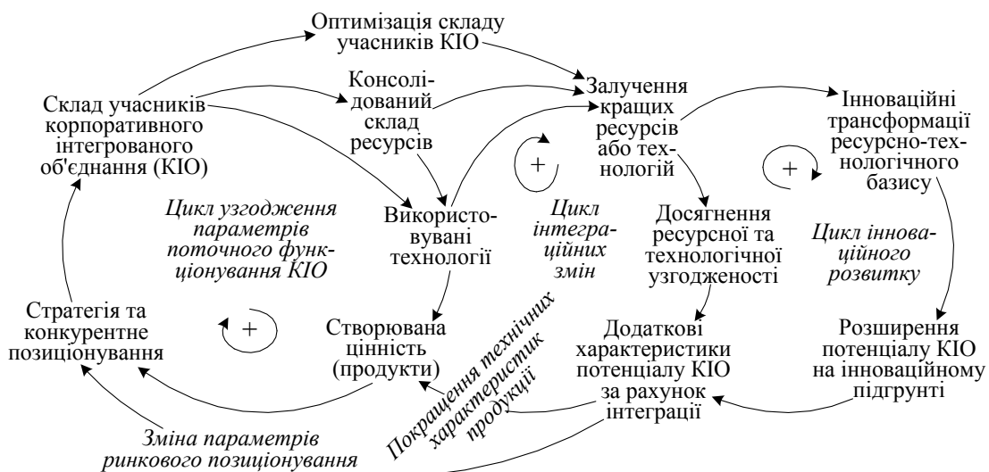
Рис. 1. Базовий варіант реалізації процесів інтеграційно-інноваційного розвитку корпоративного об'єднання

Виклад основного матеріалу дослідження. В основу реалізації мети статті покладемо розробки Д.Ю. Каталевського [16] щодо відображення ефекту зростаючої віддачі, під якою розуміється «такий приріст одного з параметрів системи, який