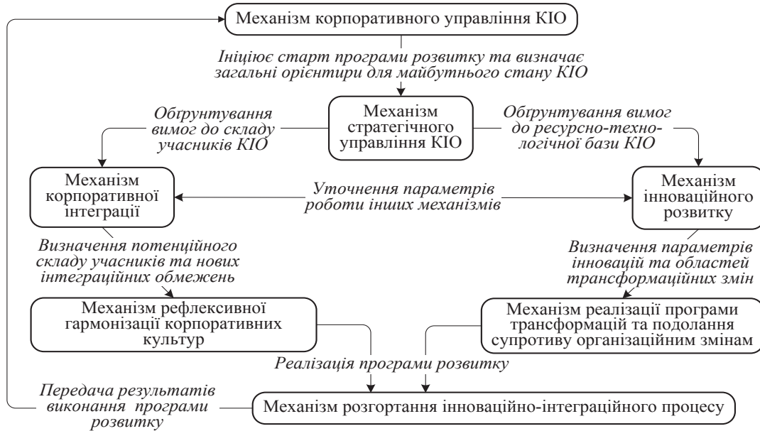
Рис. 4. Розкриття логіки взаємодії механізмів корпоративної інтеграції та управління інноваційною діяльністю

Висновки. Отже, у статті розвинуто теоретико-методологічні положення щодо організації управління та підвищення ефективності інтеграційних