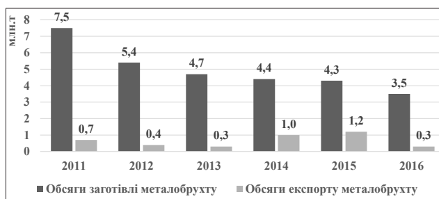
Рис. 1. Динаміка обсягів заготівлі та експорту металобрухту в Україні у 2011-2016 рр.

Стрімка динаміка зростання дефіциту брухту чорних металів на українському ринку спостерігалася внаслідок скорочення обсягів його заготівлі за зростаючих обсягах експортних поставок. Впродовж 2013-2015 рр. експорт металобрухту з України збільшився у чотири рази, а саме з 0,3 до 1,2 млн. т. Протягом останніх п'яти років обсяги заготівлі металобрухту в Україні зменшилися більш ніж вдвічі, а саме з 7,5 до 3,5 млн. т. (рис. 1). Недопоставки українським металургам металобрухту стали одним з ключових факторів скорочення вітчизняного виробництва сталі у період 2013-2015 рр. з 33 до 23 млн. т на рік [8].