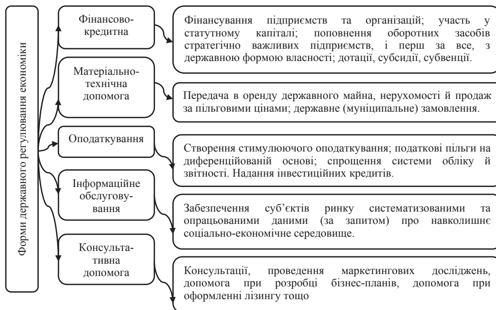
Рис. 2. Форми державного регулювання економіки