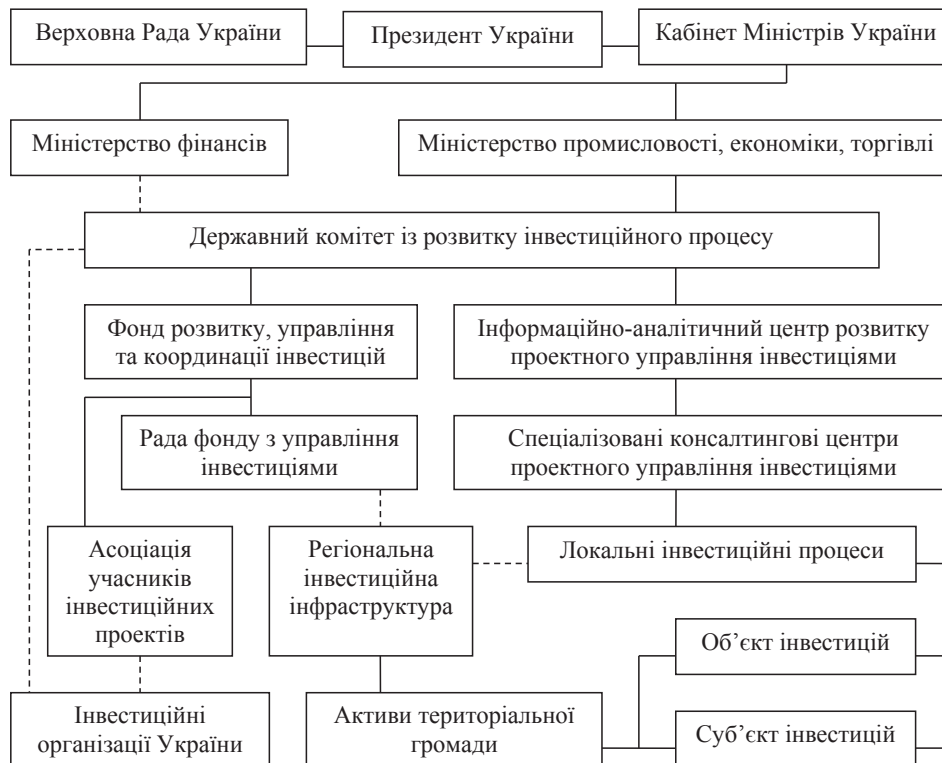
Рис. 2. Механізм реалізації регіональних державних інвестиційних проектів

На думку Б.О. Язлюка «...державне регулювання розвитку регіонів забезпечують запровадженням відповідних пріоритетів, тобто наданням переваги на конкретному етапі розвитку окремих галузей, видів діяльності, форм господарювання конкретних регіонів» [2, с. 112]. Залежно від поставлених цілей та рівнів управління пріори-