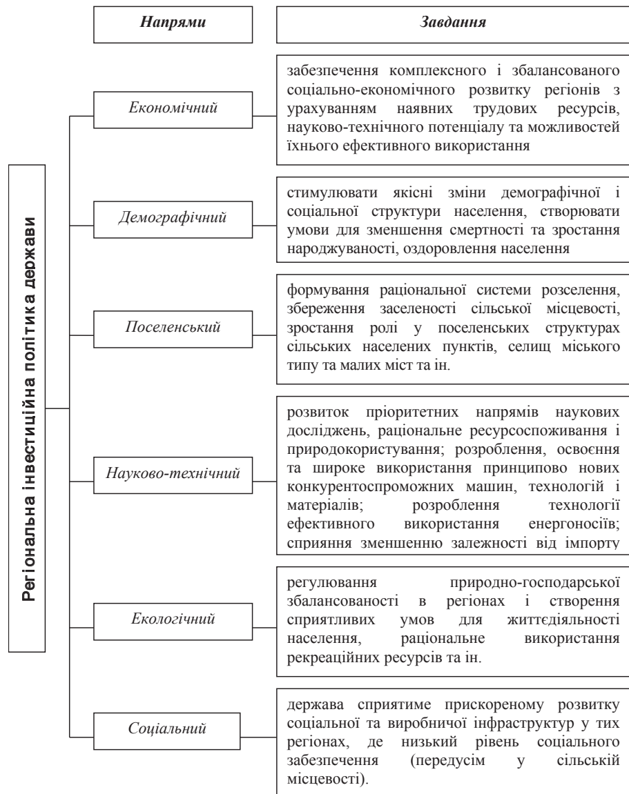
Рис. 3. Напрями регіональної інвестиційної політики держави

Проаналізувати соціальні ефекти від реалізації інвестиційної програми чи проекту можна за