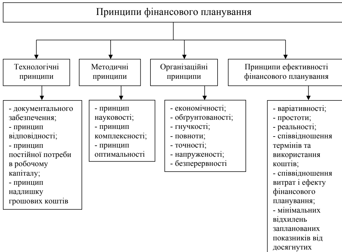
Рис. 2. Систематизація принципів фінансового планування

Принцип оптимальності в плануванні полягає у виборі одного найоптимальнішого планового рішення з можливих варіантів плану.