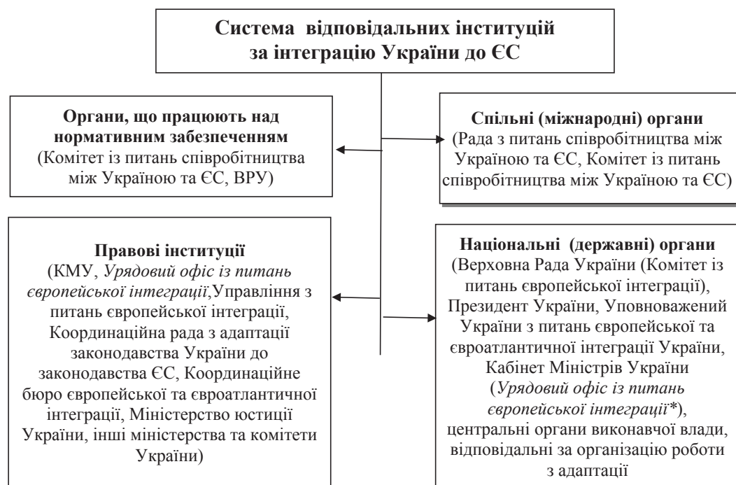
Рис. 2. Система інституцій, відповідальних за євроінтеграцію України