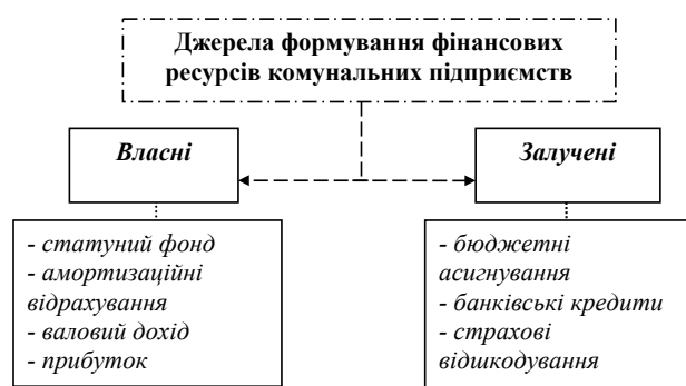
Рис. 2. Джерела формування фінансових ресурсів підприємств комунальної власності

Однак основним джерелом фінансування комунальних підприємств виступають бюджетні кошти, що створює додаткове навантаження на бюджет та унеможливило активне оновлення їх основних фондів. Така ситуація перешкоджає здійсненню