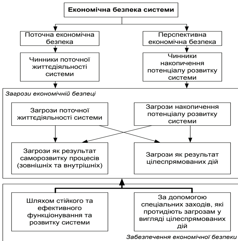
Рис. 1. Модель економічної безпеки системи

Дане визначення можна подати у вигляді схеми (рис. 1). В основі