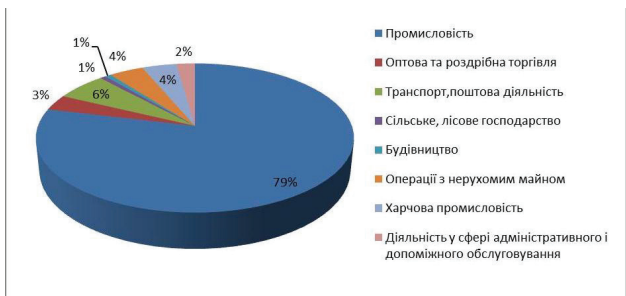
Рис. 5. Іноземні інвестиції (від загального обсягу залучених інвестицій)

У цілому зменшення сукупного обсягу іноземного капіталу, враховуючи курсову різницю і півріччя 2014 р., становило 40,0 млн дол. США, що на 9,1% менше обсягів інвестицій на початок року (10–11-те місця серед областей України) [9].