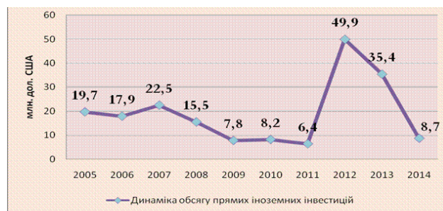
Рис. 2. Динаміка обсягу залучення прямих іноземних інвестицій за I півріччя 2005–2014 рр.

Згідно з даними головного управління статистики у Закарпатській області за 1994 – I півріччя 2014 р., в Закарпатську область залучено 397,5 млн дол. США прямих іноземних інвестицій (акціонерного капіталу) (13-те місце серед областей України), що відповідно становить 317,3 дол. США у розрахунку на одну особу (13-те місце серед регіонів України) (див. рис. 2).