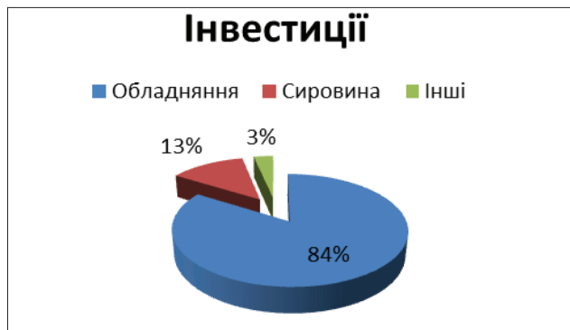
Рис. 1. Реалізація інвестиційних проектів

а прями іноземні інвестиції (далі – ПІІ) – 17,2%. І можна сказати, що іноземного інвестора більше приваблює економіка Закарпаття в цілому, ніж преференції в СЕЗ. Слід зауважити, що з моменту введення спеціального режиму інвестування на реалізацію інвестиційних проектів було укладено 47 договорів на суму 190 млн дол. США. На сьогодні реалізовано вже близько 16% загальної суми інвестицій (див. рис. 1).