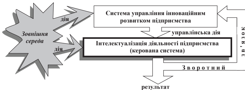
Рис. 2. Укрупнена схема дворівневої структури управління інноваційним розвитком підприємства

3. Принцип системної структуризації. Передбачає доцільність структуризації знань, що є альтернативним джерелом економічних перетворень на інноваційній основі та зумовлює вибір відтворювальної інтерпретації сутності та змісту інтелектуалізації діяльності