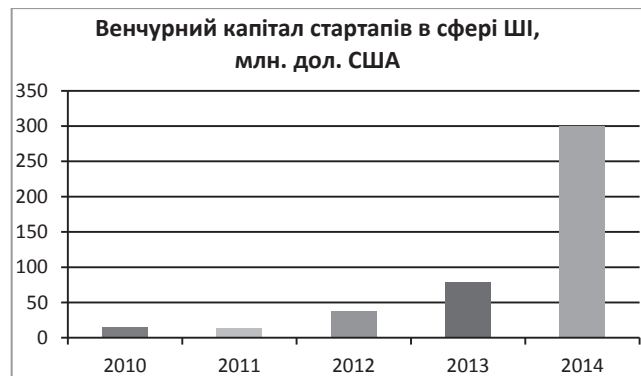
Рис. 1. Динаміка кількості нових стартапів у сфері ШІ та їхній венчурний капітал у 2010–2014 рр.