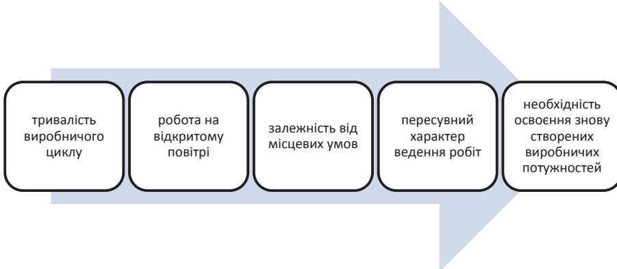
Рис. 3. Особливості будівельного виробництва

Висновки. Головна функція та мета будівельної галузі – зведення нових