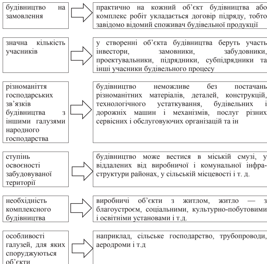
Рис. 1. Організаційно-економічні особливості будівельної діяльності