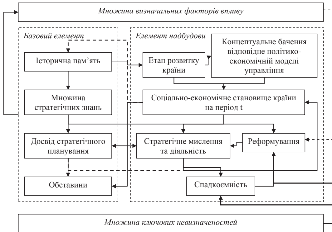
Рис. 1. Реконструкція ментальної моделі державного стратегічного планування.

де F^v = \{f_i^v\} - множина визначальних факторів впливу, F^v \subset F , де F = \{f_i\} - множина факторів