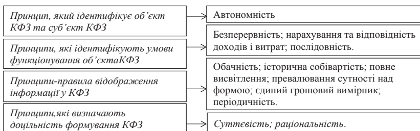
Рис. 1. Класифікація принципів КФЗ вітчизняних банківських установ

Реалізація принципу автономності наштовхується також на проблему його інтерпретації з точки зору визначення об'єкта та суб'єкта КФЗ. Так, при визначенні об'єкта КФЗ потрібно керуватися принципом автономності у поєднанні з принципом превалювання сутності над формою, під яким розуміється розкриття інформації про факти, процеси, об'єкти господарського життя у звітності, враховуючи їх економічний зміст, а не лише юридичну форму [16]. У цьому разі мова йде про підхід до консолідованої групи не з точки зору власності, а з точки зору відносин контролю.