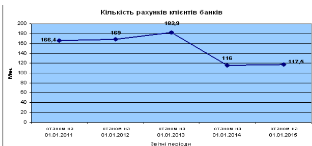
Рис. 2. Кількість рахунків клієнтів банків, млн. грн. [11]

у тому числі поточних – 101,1 млн. ( 86,0% від загальної кількості рахунків, відкритих у банках); вкладних – 16,4 млн. ( 14,0% від загальної кількості рахунків, відкритих у банках). За 2014 р. загальна кількість відкритих клієнтами рахунків збільшилася на 1,5 млн.