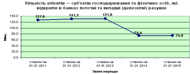
Рис. 1. Кількість клієнтів – суб'єктів господарювання та фізичних осіб, які відкрили в банках поточні та вкладні (депозитні) рахунки, млн. грн. [11]

Відповідно до таблиці 4, станом на 01.01.2015 р. в Україні існують такі платіжні системи, платіжними організаціями яких є небанківські установи: «Поштовий переказ», «ІнтерПейСервіс», «24NONSTOP», «Фінансовий світ», «Розрахункова фондова система», «ГлобалМані», «ОМП», «ЕлМІ».