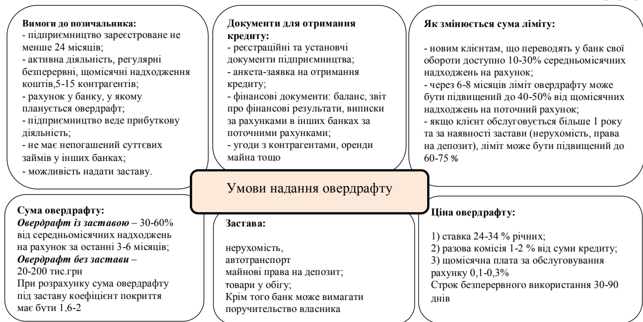
Рис. 4. Умови надання овердрафту банками України станом на липень 2015 р.