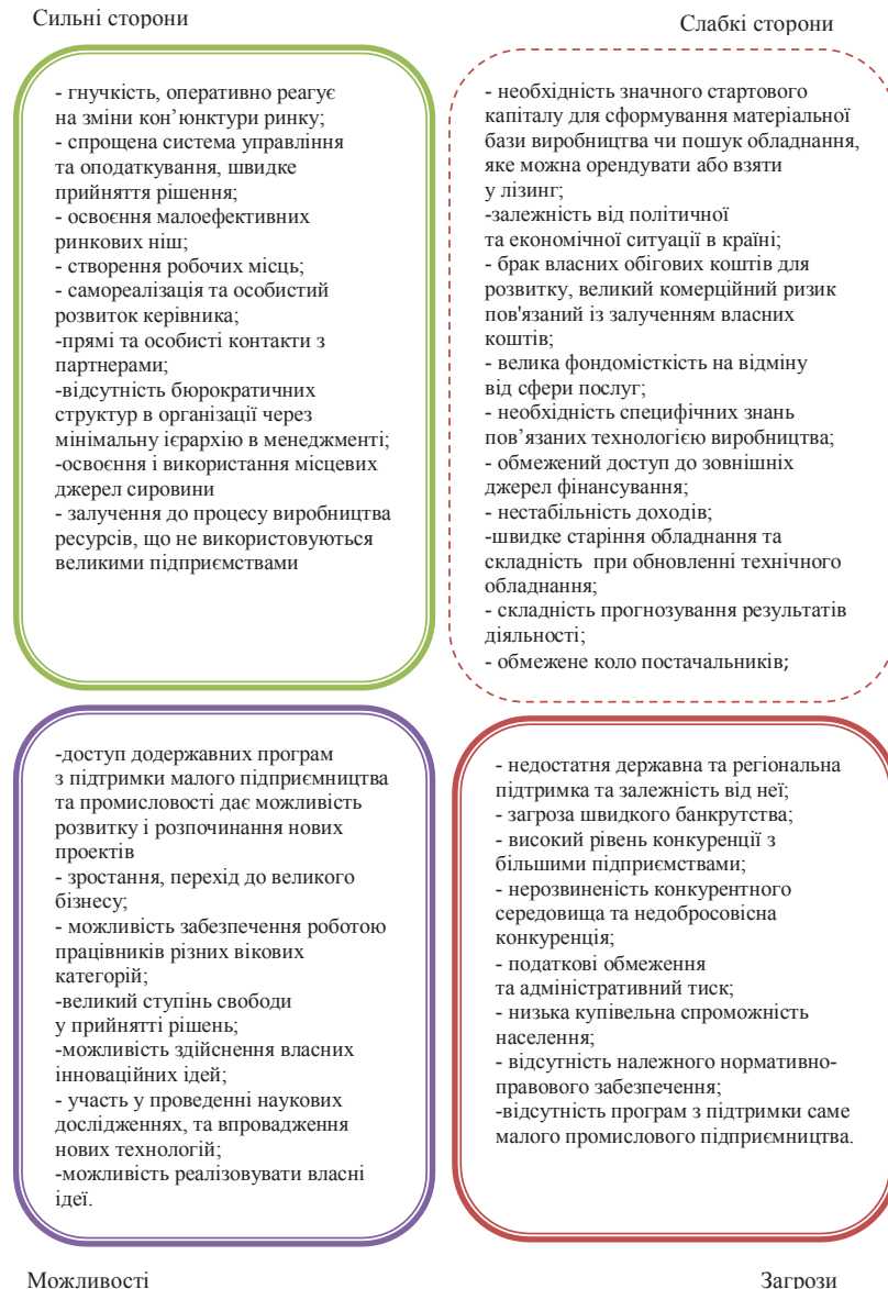
Рис. 2. SWOT-аналіз МПП України