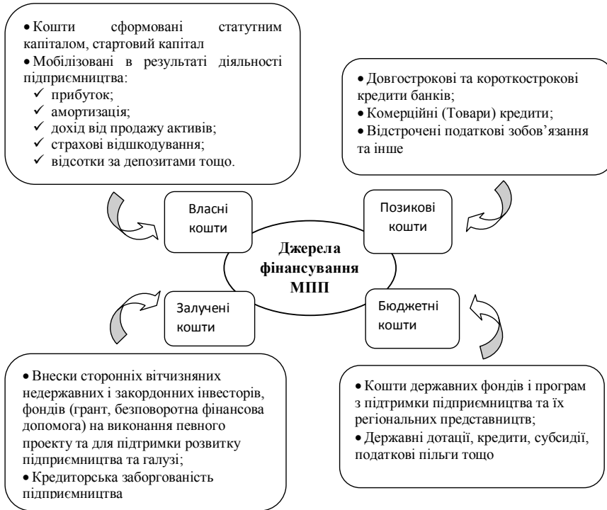
Рис. 3. Джерела фінансування МПП України

На сьогоднішній день кредитування стало майже недоступним джерелом для підприємництва через складну економічну ситуацію та кризу банківської сфери. Найменші складності пов'язані із отриманням кредиту у вигляді овердрафту. З англійської «овердрафт» (overdraft) перекладається як «короткостроковий кредит» (over – понад, draft – проект) – форма короткострокового кредиту в межах встановленого банком ліміту, що дозволяє здійснювати розрахунки, коли у клієнта на поточному рахунку недостатньо коштів. За умов овердрафт банком розрахункового рахунку клієнта здійснюється для оплати розрахункових документів при нестачі або відсутності на розрахунковому рахунку клієнта – позичальника коштів. Банк списує кошти з рахунку клієнта в повному обсязі, тобто автоматично надає клієнту кредит на суму, що перевищує залишок коштів. Овердрафт