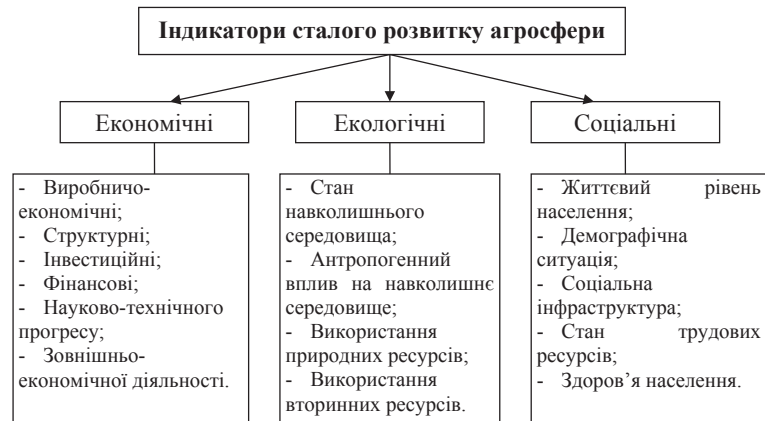
Рис. 2. Показники (індикатори) сталого розвитку агросфери

- збільшення обсягів виробництва сільськогосподарської продукції з відповідними індикаторами розвитку: збільшення обсягів виробництва валової