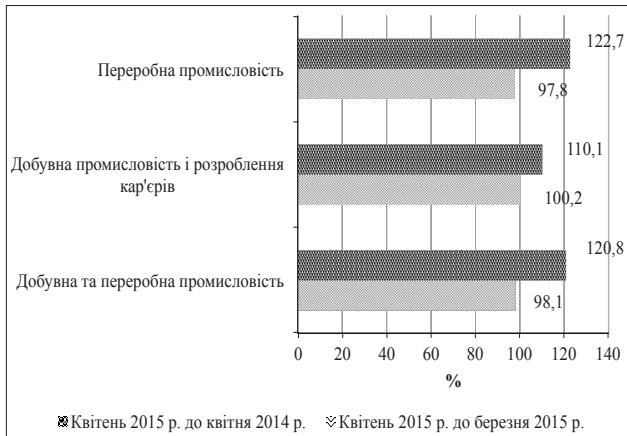
Рис. 1. Графічне представлення співвідношення індексів обороту (реалізації) продукції добувної та переробної промисловості за видами діяльності за квітень 2015 р. 3

Порівнюючи значення індексу обороту (реалізації) продукції добувної та переробної промисловості у березні та квітні 2015 р., можемо зазначити збільшення обсягів таких видів діяльності, як добування кам'яного та бурого вугілля, добування інших корисних копалин та розроблення кар'єрів, виробництво харчових продуктів і напоїв та тютюнових виробів, поліграфічної діяльності, виробництво коксу та коксопродуктів, виготовлення автотранспортних засобів, причепів і напівпричепів та інших транспортних засобів.