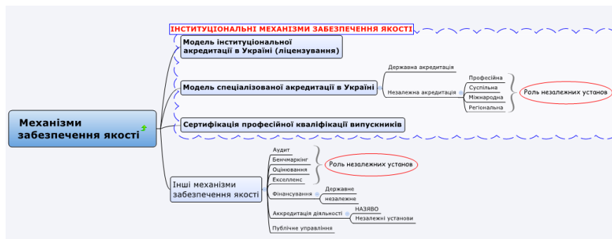
Рис. 2. Механізми забезпечення якості освіти – інституціональні зв'язки системи забезпечення якості вищої освіти