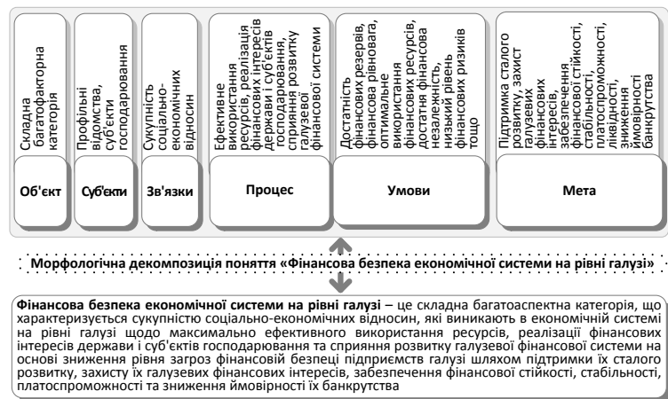
Рис. 2. Аналіз поняття «фінансова безпека економічної системи на рівні галузі»

Низка досліджень фінансової безпеки мезорівня присвячується агропромислового комплексу (АПК). Так, М.В. Лучик [11] в якості фінансової безпеки аграрної сфери розглядає систему фінансового захисту інтересів галузі та зниження рівня загроз суб'єктам господарювання із забезпечення їх фінансової стійкості, платоспроможності, мінімального ризику ймовірності банкрутства. Н.А. Кулагіна [10] визначає досліджуване явище як один з найважливіших елементів системи економічної безпеки, як такий стан фінансової системи суб'єкта господарювання АПК, за якого забезпечена фінансова стійкість, платоспроможність, присутні мінімальні ризики вірогідності банкрутства і який сприяє підвищенню вартості бізнесу. О.В. Тихомиров [18] досліджує економічну безпеку галузі охорони здоров'я, в якості показників якої обрано індикатори економічного обігу в галузі, чисельність суб'єктів медичної діяльності в галузі, їх середня норма прибутку і рентабельність, ціни на медичні послуги, участь держави у ролі платника в собівартості медичних послуг, економічна забезпеченість потреби громадян в медичних послугах. Загалом, показники економічної безпеки галузі мають на меті відобразити відсутність відхилень у нормальному режимі розвитку еконо-